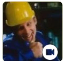
Niemiecki film o BHP