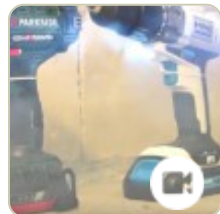
Test wkrętarek Niteo Tools; Parkside; MacAlister