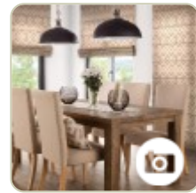
Rolety do okien w kuchni i jadalni