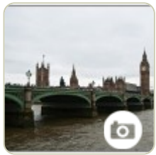
Najpiękniejsze mosty świata