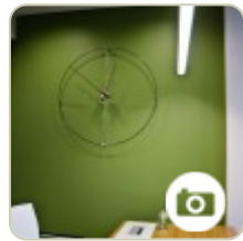
Oryginalne oświetlenie do gabinetu menadżera