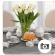
Jak przygotować stół na Wielkanoc?