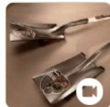
Jak to jest zrobione - Łopata